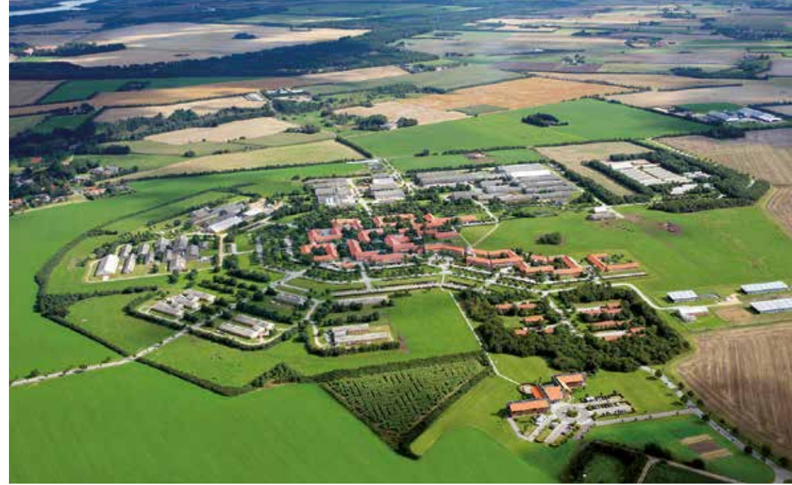
Forskningscenter Foulum, der nu hører under Århus Universitet, blev oprettet i 1984.

Men til trods for landbrugets og miljøforkæmpernes fælles interesse i denne målsætning, fortsatte debatten som følge af for stramt fastsatte tidsfrister,