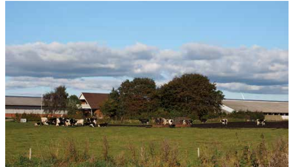
Siden Danmarks indtræden i EF/EU er der investeret massivt i nye moderne stalde med en stigende produktion på stadig færre, men betydeligt større enheder.

Størst diskussion blandt landmændene var der nok om, hvilke strukturændringer der var behov for i andelsvirksomhederne. Det var nu, hvor mælke-transporten til mejerierne ikke længere foregik med heste, oplagt at lægge de små mejerier sammen, så de kunne udnytte mejeriteknologien optimalt. Men mens flertallet længe ønskede at fastholde en lokal forankring, blev der med stigende styrke argumenteret for, at stordriftsfordelene ikke alene var teknologiske, men nok så meget lå i en samling af råvarernes rationelle udnyttelse og i en koordineret salgsindsats på landsplan. Derfor blev der allerede i 60'erne argumenteret for, at endemålet måtte være samling i landsomfattende andelsselskaber indenfor alle produktionsgrene. Denne