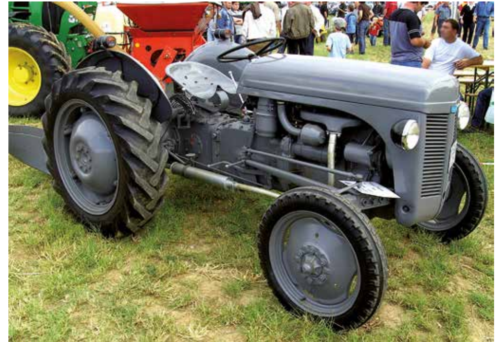
Da den grå Ferguson i 50'erne afløste hestene, frigjorde den store arealer til øget fødevarerproduktion med det resultat, at de frie markeder blev overfyldt og priserne faldt.

Da afløsningen af heste med traktorer efterhånden frigjorde arealer til fødevarerproduktion, blev de frie markeder overfyldt, og derfor ramtes danske landmænd i 1957 af en alvorlig prisfaldskrise, der udløste en voldsom diskussion om landbrugets fremtid. Nogle argumenterede for, at landbruget skulle tage industrielle metoder i brug, andre for anvendelse af mere moderne salgsmetoder og for indførelse af centralsalg overfor lande med centralt indkøb samt for, at priserne på hjemmemarkedet skulle følge omkostnings-