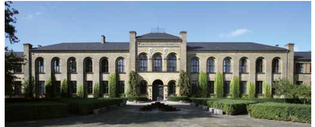
I 1858 etableredes Den Kgl. Veterinær- og Landbohøjskole - nu en del af Københavns Universitet.

Initiativrige bønder fik tillige i 1840'erne sæde i ledelsen af de første lokale landboforeninger, som oftest nogle godsejere fik oprettet. Foreningerne havde et begrænset medlemstal. De virkede ved at udbrede landbrugsfaglige skrifter, afholdelse af diskussionsmøder og dyrskuer. Da rigsdagen i 1852 vedtog en lov om husdyrbrugets fremme med tilskud til dyrskuepræmier, satte det for alvor fart i foreningsdannelsen. Men det var først mod slutningen af 1800-tallet, at de fleste lokale landboforeninger var dannet, og at flertallet af landmændene havde tilsluttet sig. På dette tidspunkt havde man