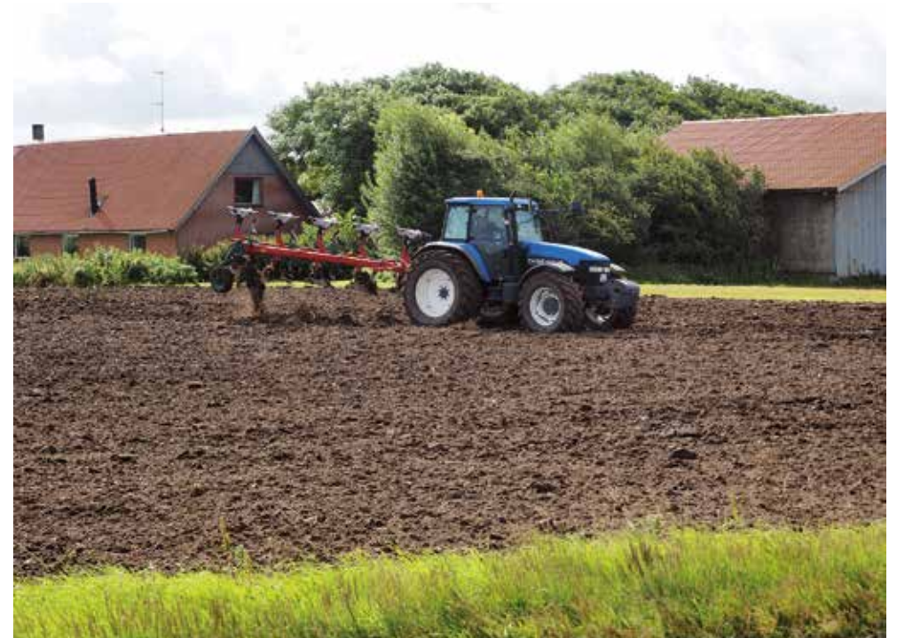
Trods øget produktion har større og mere moderne maskiner mindsket behovet for arbejdskraft i dansk landbrug, der nu er koncentreret på markant større og færre enheder.

Koncentrationen på færre og større bedrifter har imidlertid givet nye udfordringer. Ikke alene er arronderingen blevet forringet i forbindelse med forekommende arealforøgelsesmuligheder med for megen vejtransport til