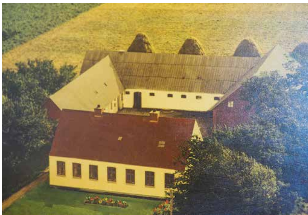
Der er sket meget i dansk landbrug siden dette luftfoto blev taget i 1953 af et velholdt husmandsbrug i Nr. Thise i Nordsalling, hvor høet dengang blev sat i stakke.