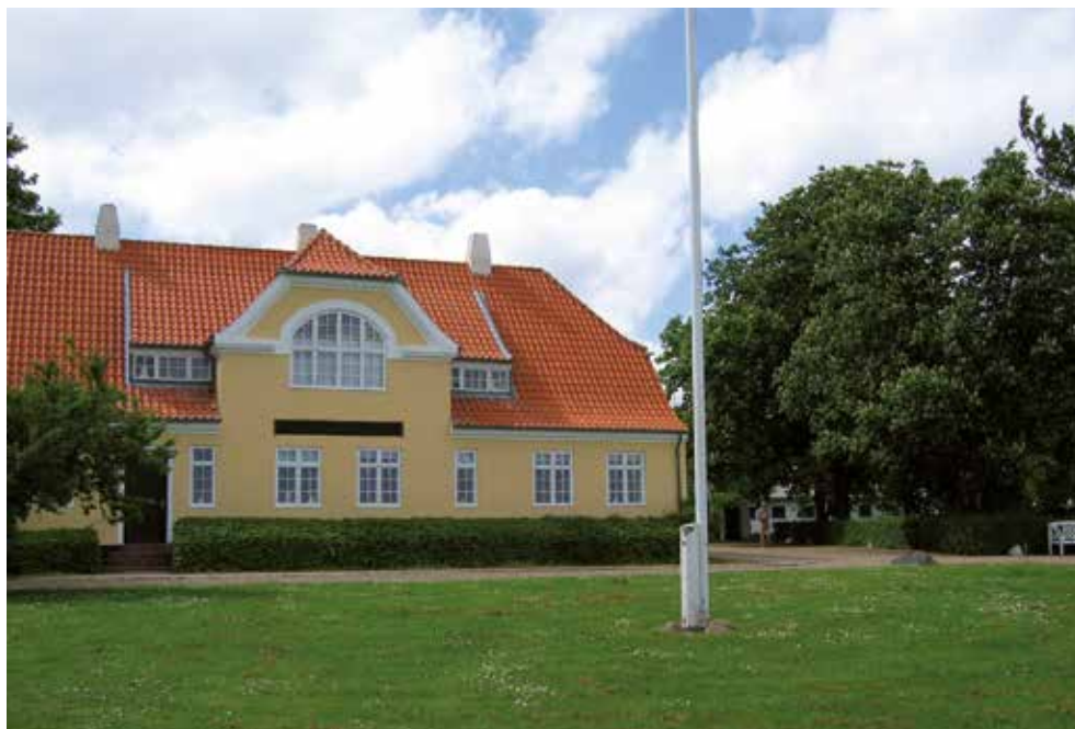
Den folkekære digter Jeppe Aakjær's hjem, "Jenle" i Salling, der nu er indrettet som museum.

Kulturelt har vi her i landet klaret os godt, men med den store tilstrømning af mennesker med en helt anden kulturel baggrund, skal vi, som Bertel Haarder siger, værne om den danske kultur, og ikke tage imod flere, end vi kan behandle godt og anstændigt.