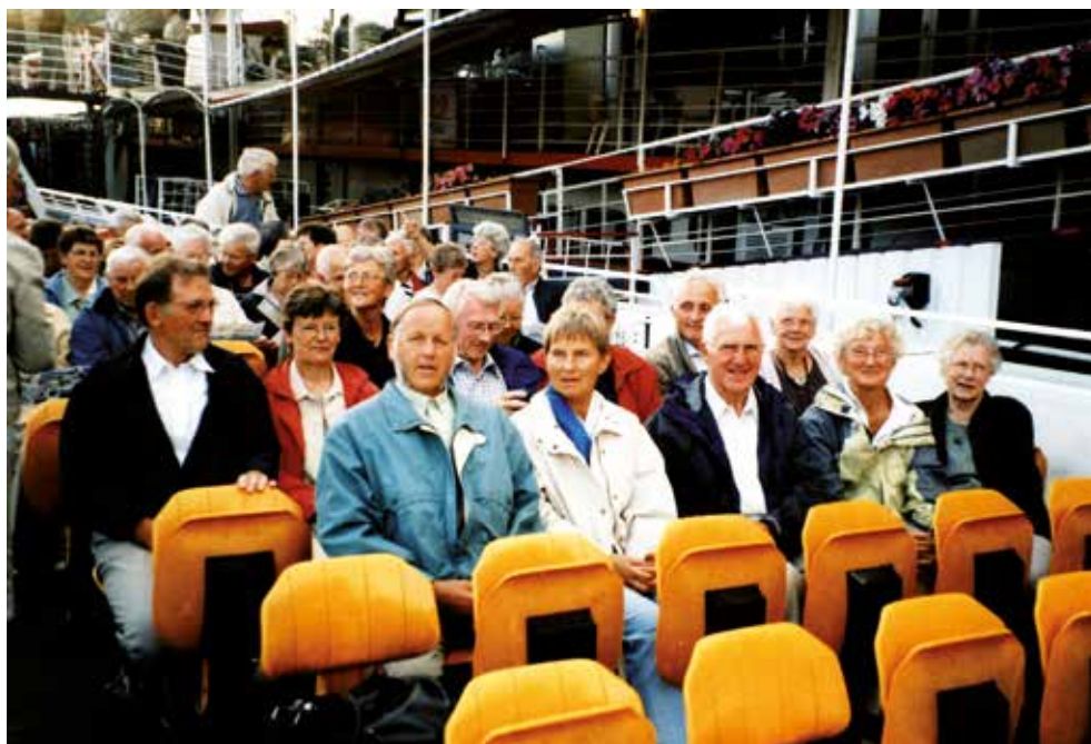
Kanalrundfart i Paris på en af de mange rejser, som LandboSenior i Skive har gennemført.

De gode forhold, vi har på Landbogården, hvor alle føler sig hjemme, er en væsentlig faktor for vores klubs fremgang.