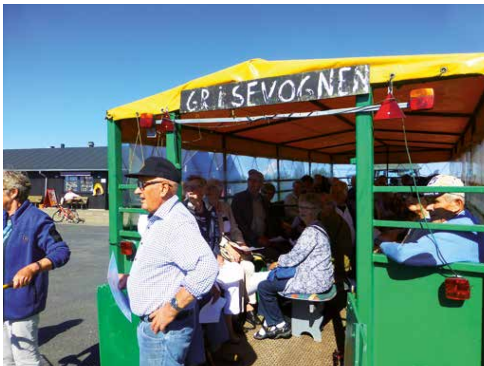
Grisevognen på Baagø må kun medtage 40 passagerer. De sidste 14 måtte tage turen på cykel.

Vi havde en rigtig god oplevelse i august 2016, da vi skulle en tur til Baagø – det kan varmt anbefales! Vores endagsture er altid eftertragtede, så en uges tid før, vi skulle afsted, ringede jeg glad til rejseselskabet, Søren Rejser, og sagde: “Så er bussen fuld, vi er 54!”.