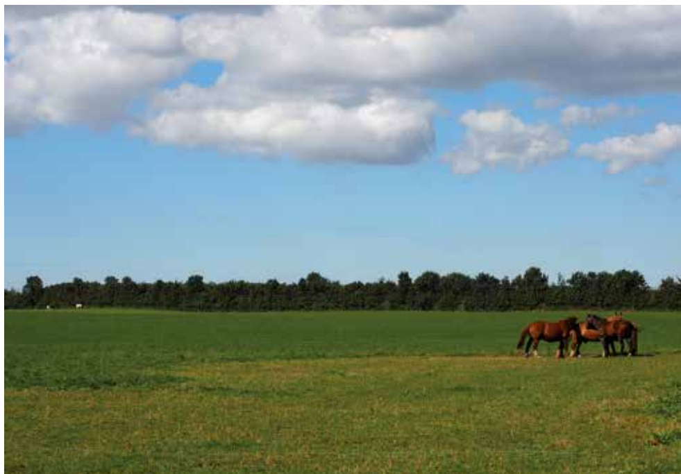
Selv om hestene stort set er forsvundet som trækraft i landbruget er de fortsat udbredte i Danmark – nu primært som hobbydyr og til sportslige formål.