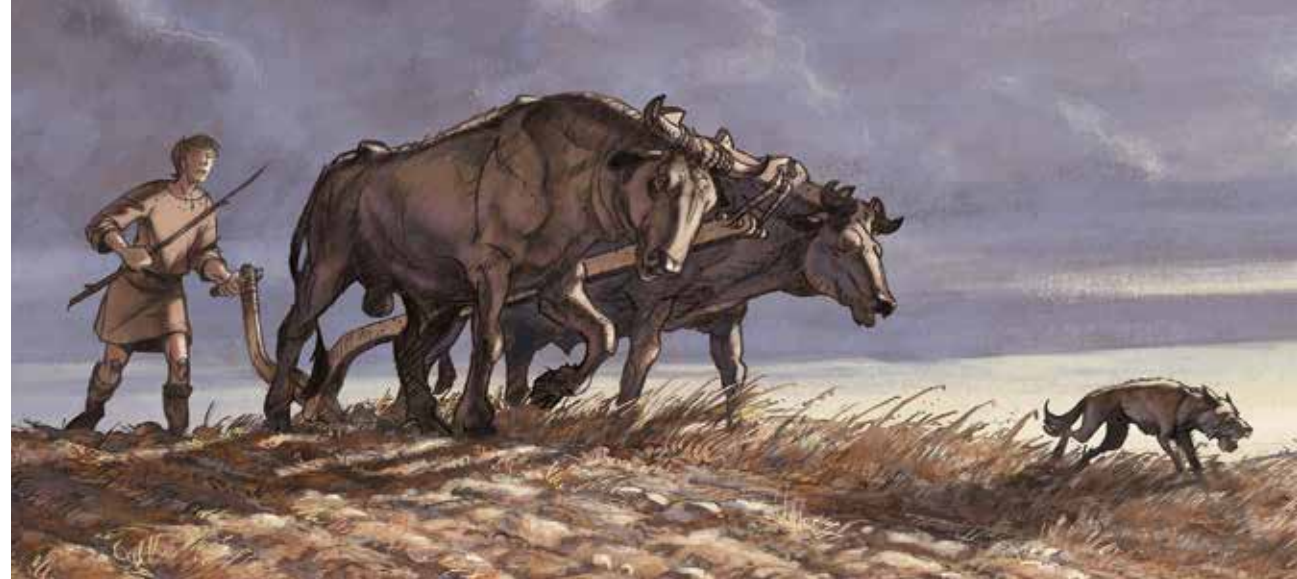
Pløjning med ard - illustration af Niels Bach til Tollundmanden.dk for Silkeborg Museum.

Også i slægtledene før Åkjærs sang skete der store ændringer. Vore oldeforældre grundlagde det alsidige husdyrlandbrug og startede andelsvirksomhederne og den landmandsejede fødevarerindustri i 1880'erne. Tipoldeforældrene oprettede de første højskoler samtidig med, at de havde opbygget en indbringende eksport af korn og stude, efter at tiptipoldeforældrene i bogstaveligste forstand havde beredt jordbunden herfor ved at tage svingploven i brug og sørge for stenrydning, udgrøftning og mergling samtidig med, at de tog del i de første landboforeningers dannelse og i valg til stænderforsamlingerne. Forud var gået vore tip-tip-tipoldeforældres indsats med ophævelsen af det forældede dyrkningsfællesskab, udskiftningen af landsbyernes jorder, inddigning af dem, og bygning af mange nye gårde ude på markerne. I kontrast til dette hastige udviklingsforløb gennem det sidste par århundreder var der i tiden før landboreformerne ikke alene flere generationer, men flere århundreder mellem væsentlige nybrud i landbruget.