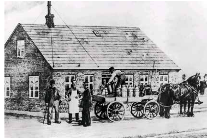
Verdens første andelsmejeri blev etableret i Hjedding nord for Varde i 1882

Heldigvis formåede danske bønder at tage udfordringen op ved at fremskynde den allerede igangværende proces med at lægge stigende vægt på husdyrbruget - især malkekvæget. De store gårde havde allerede fra midten af 1700-tallet begyndt at satse på malkekvægbruget til supplement af kornsalg ved at indrette de såkaldte hollænderier, dvs. gårdmejerier, som man havde begyndt med i Holland, og som via Holsten og Angel nu kom til Danmark - ofte forestået af hollændere eller holstenerne. Således var en af