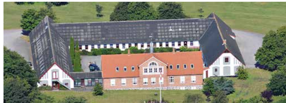
Landbrugets Seniorklub-Bornholm holder de fleste af sine møder på Kannikegård ved Nexø, der også er hjemsted for Bornholms Landbrug.

Til alle vore møder er der altid lejlighed til at udveksle tanker, synspunkter samt hygge. Så når livets afslutning også er på programmet, så er det jo et led i det liv, vi har. Den danske sang har givet føde til livskvalitet samt de bornholmske sange, som også findes. Når så rigtig gode oplægsholdere er indover, så går man altid livskraftig hjem fra sådan en eftermiddag.