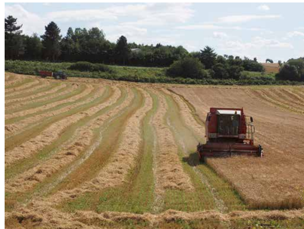
Strukturudviklingen og mekaniseringen i dansk landbrug er gået stærkt siden 2. Verdenskrig, men den er næppe til vejs ende.

Jeg faldt en dag over en god titel, som lød: Hvordan bliver man en glad pensionist? Ja hvordan bliver man det? Er svaret ikke en vifte af forskellige ting, som vi selv har stor indflydelse på? De fleste af os har det rigtig godt – og det skal vi nyde og kun mindes de gode stunder, og udnytte de muligheder, vi har. Og ikke ligge under for Janteloven. Misundelse er en af de laveste karaktertræk og fører intet med sig - vi skal være aktive og positive!