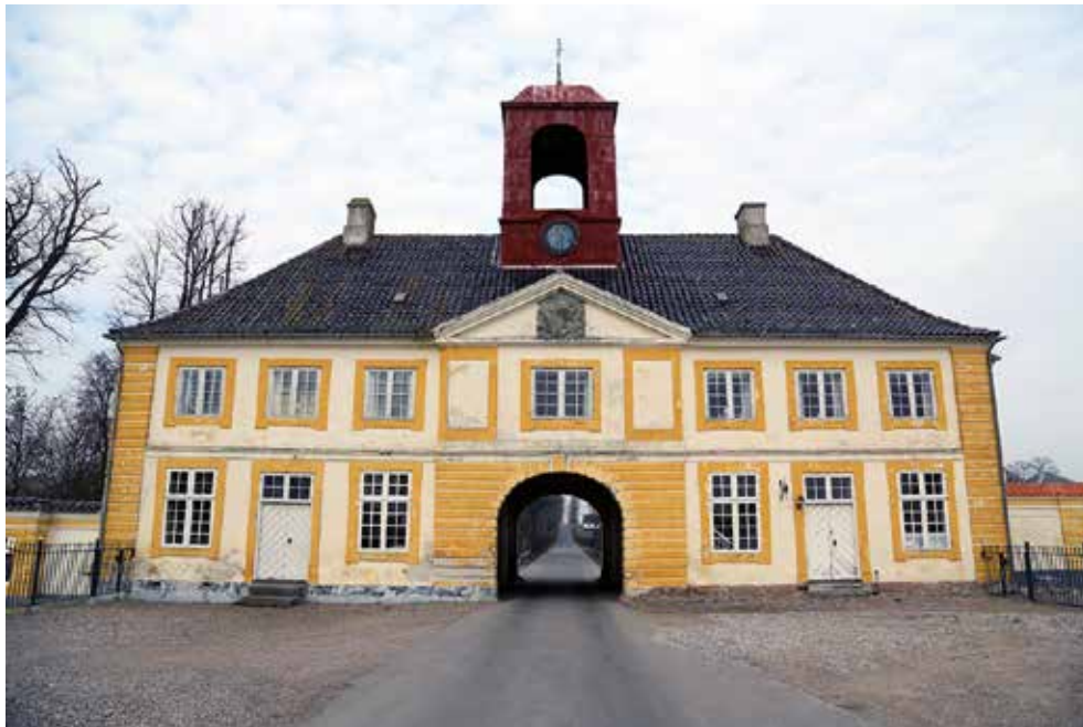
En tredages tur til Fyn bragte bl.a. deltagerne på en aftenur til Valdemar Slot på Tåsinge.

Brønderslev, og der bestilte vi plads en time om ugen i vinterhalvåret til bowling med kaffe og lidt snak bagefter. Det faldt godt i medlemmernes smag, så vi måtte ret hurtigt oprette et ekstra hold.