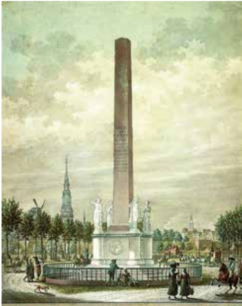
Frihedsstøtten blev opført 1792-97 uden for Københavns Vesterport, det nuværende Vesterbrogade, som et monument til minde om stavnsbåndets ophævelse i 1788.

Så meget lykkeligere var det, at den danske enevoldsmagt tidligt besluttede sig for, at de nye landbrugsmetoder skulle komme alle tilgode ved gennemførelse af en strukturreform med udskiftningen i 1781 og en personlig frigørelse med stavnsbåndsløsningen i 1788.